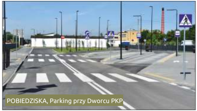
POBIEDZISKA, Parking przy Dworcu PKP