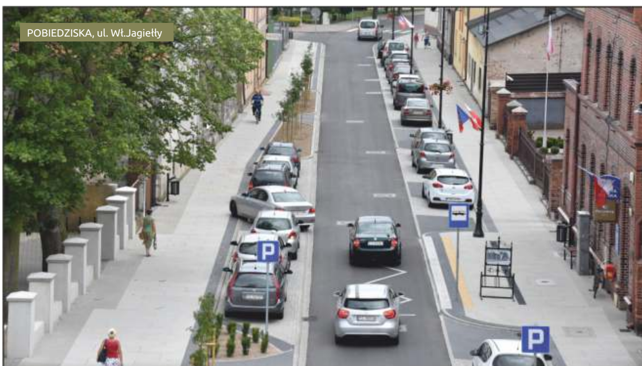
POBIEDZISKA, ul. Wł.Jagięły