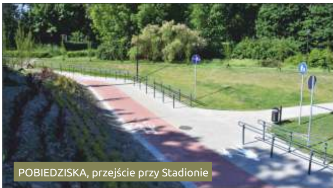
POBIEDZISKA, przejście przy Stadionie