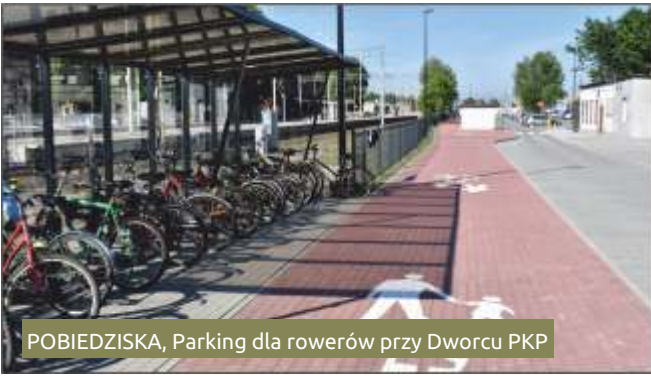
POBIEDZISKA, Parking dla rowerów przy Dworcu PKP