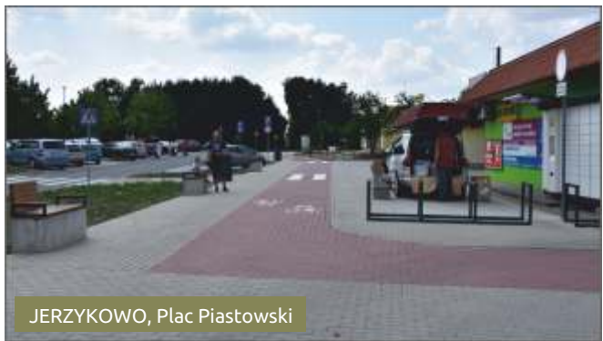
JERZYKOWO, Plac Piastowski