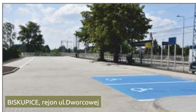
BISKUPICE, rejon ul.Dworcowej