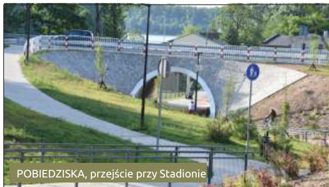
POBIEDZISKA, przejście przy Stadionie