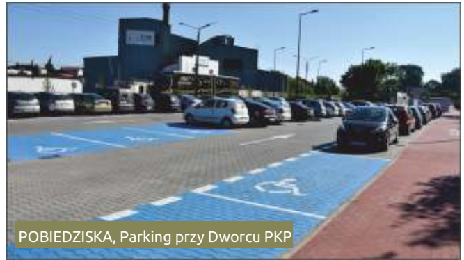
POBIEDZISKA, Parking przy Dworcu PKP