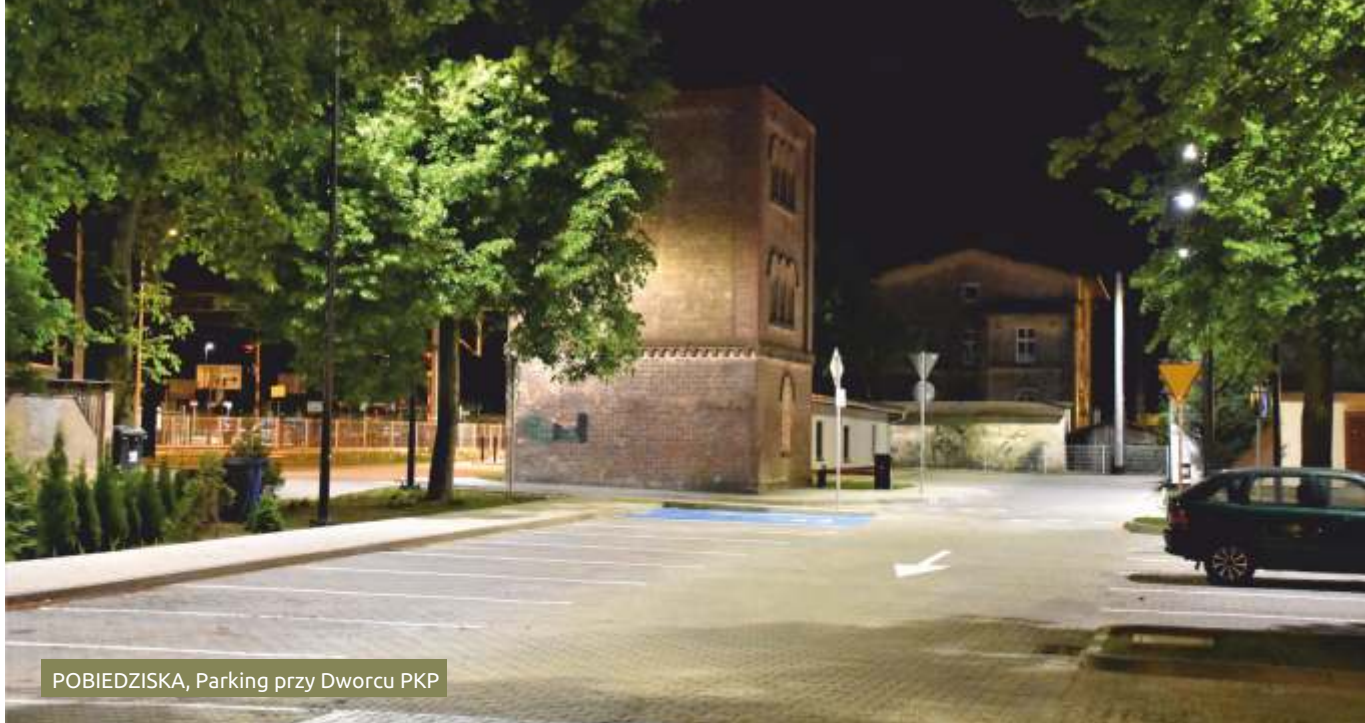
POBIEDZISKA, Parking przy Dworcu PKP