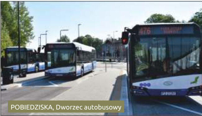
POBIEDZISKA, Dworzec autobusowy