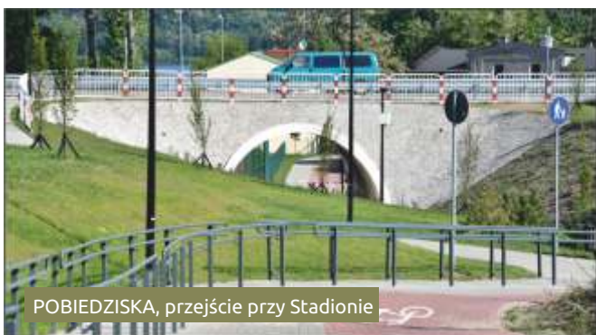
POBIEDZISKA, przejście przy Stadionie