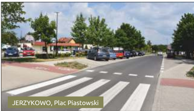
JERZYKOWO, Plac Piastowski