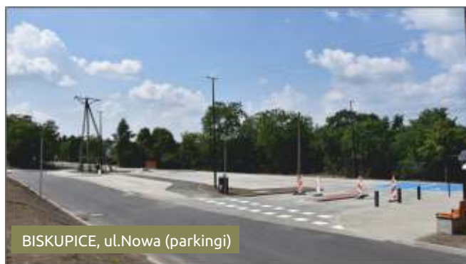
BISKUPICE, ul.Nowa (parkingi)