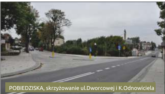
POBIEDZISKA, skrzyżowanie ul.Dworcowej i K.Odnowiciela