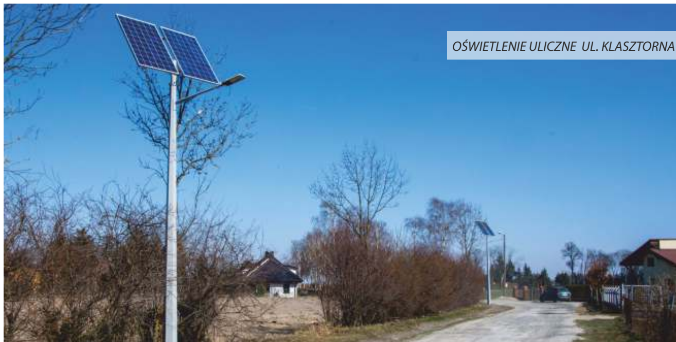
OŚWIETLENIE ULICZNE UL. KLASZTORNA