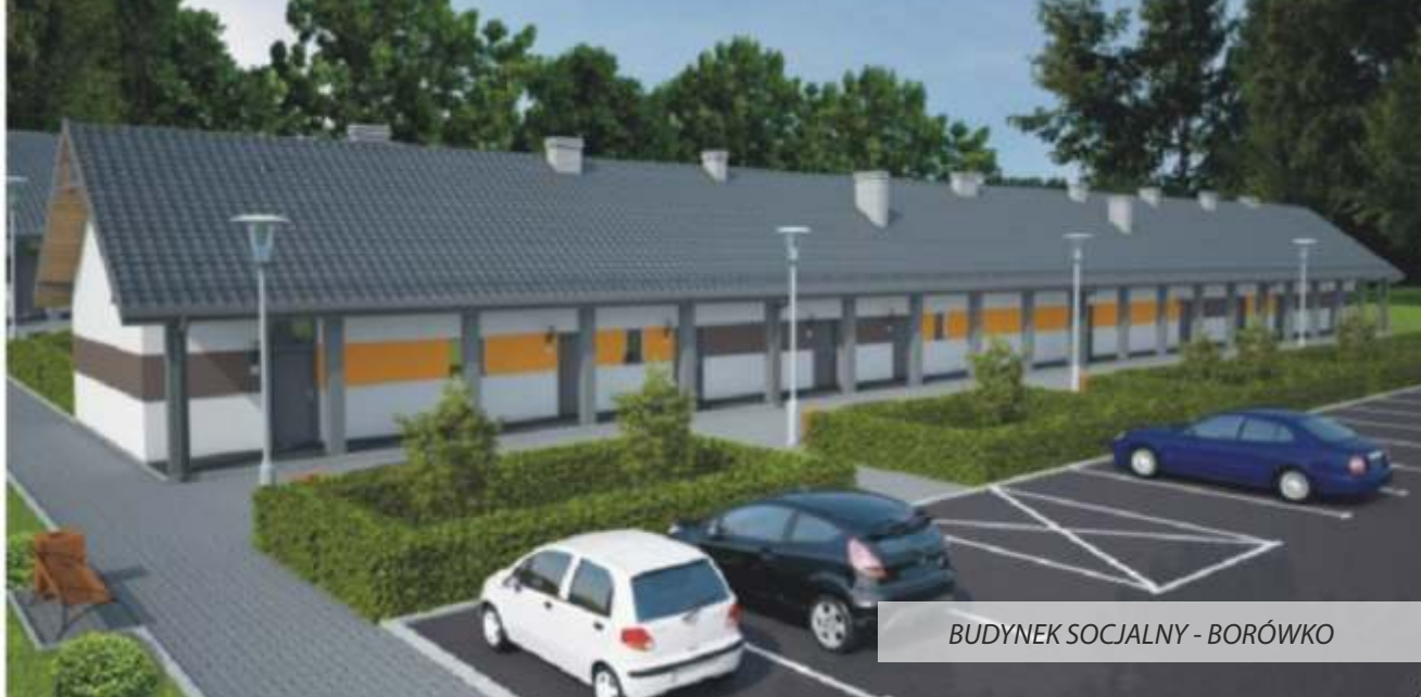
BUDYNEK SOCJALNY - BORÓWKO