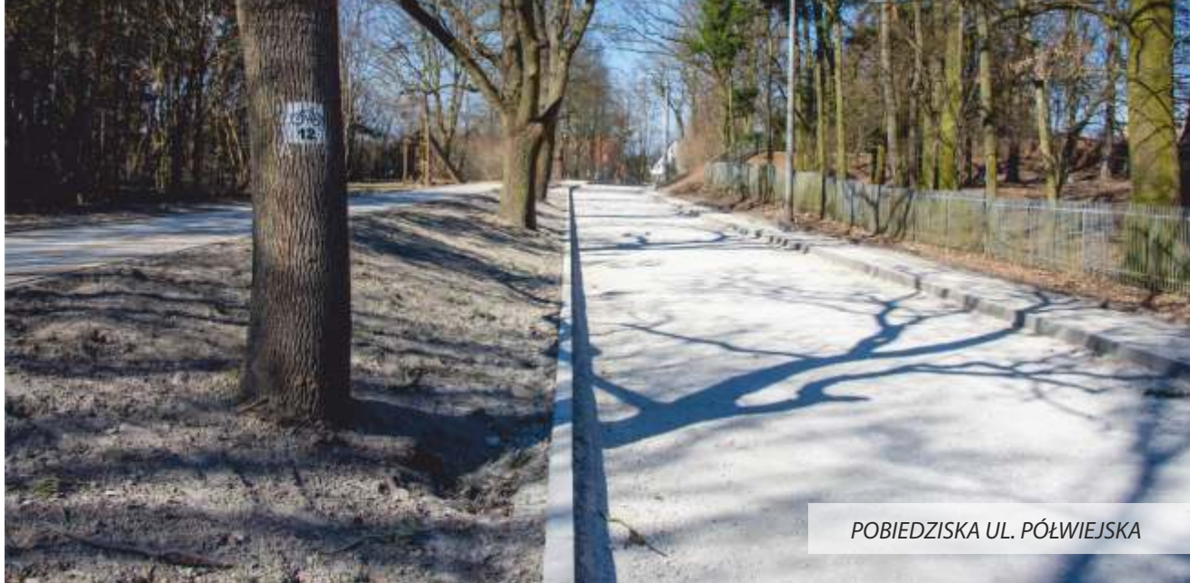
POBIEDZISKA UL. PÓŁWIEJSKA