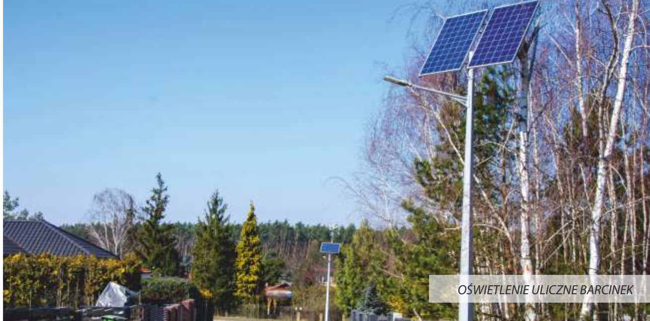
OŚWIETLENIE ULICZNE BARCINEK