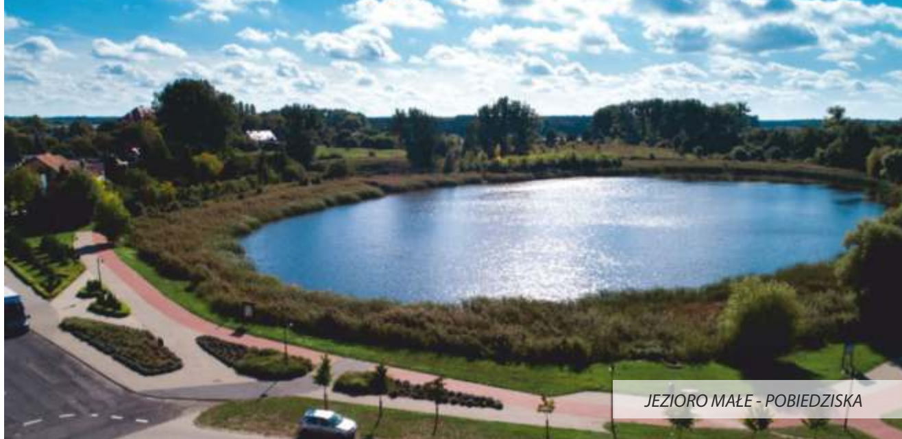
JEZIORO MAŁE - POBIEDZISKA