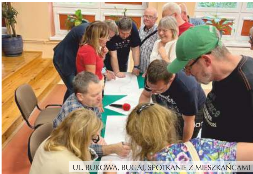
UL. BUKOWA, BUGAJ, SPOTKANIE Z MIESZKAŃCAMI

Podpisano umowę na opracowanie kompletnej dokumentacji projektowej wraz uzyskaniem wymaganych przepisami prawa budowlanego uzgodnień, opinii i pozwoleń oraz świadczenie usługi nadzoru autorskiego dla zadań inwestycyjnych pn.: Budowa ul. Bukowej w m. Bugaj wraz z odwodnieniem i pętlą autobusową wyposażoną w peron przystanku autobusowego. Wykonawca złożył koncepcję projektu. 3 czerwca br. odbyło się spotkanie z mieszkańcami. Wartość zadania 119 002,50 zł. brutto.