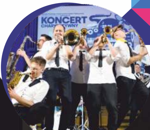
DIZZY BOYZ BRASS BAND