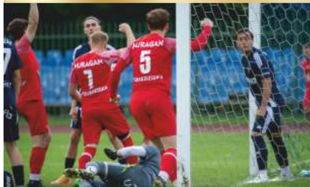
HURAGAN WYGRYWA W JAROCINIE