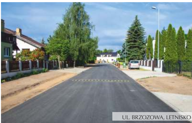
UL. BRZOWA, LETNISKO

Zakończono roboty budowlane w ulicach: Biskupice - ul. Cicha, Różana i Kwiatowa, budowa ciągów pieszo-jezdnych: Jerzykowo -ul. Jeziorna.