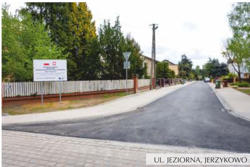
UL. JEZIORNA, JERZYKOWO