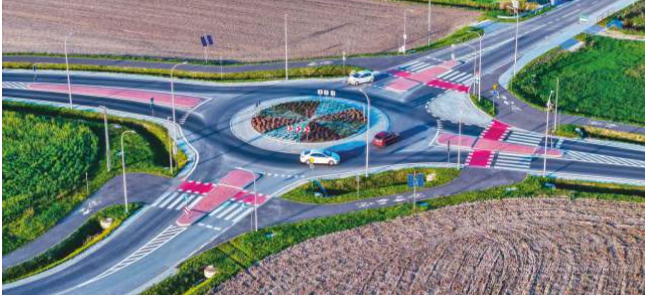
POŁUDNIOWA OBWODNICA POBIEZISK