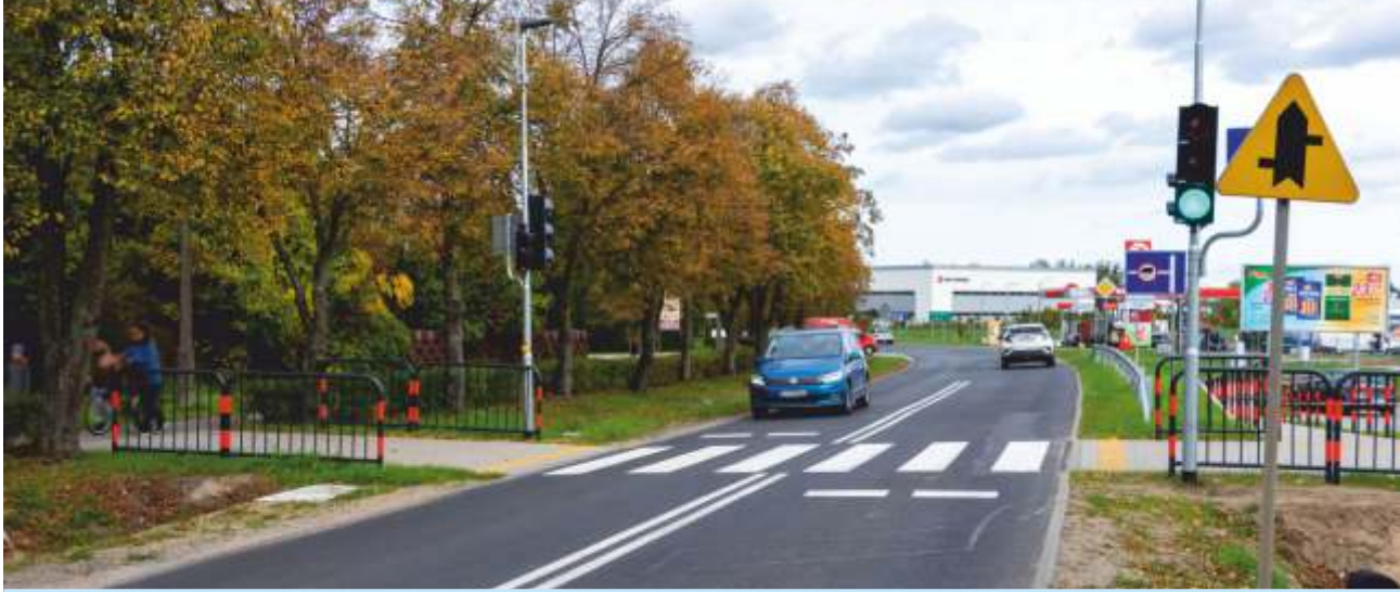
POBIEDZISKA UL. KOSTRZYŃSKA