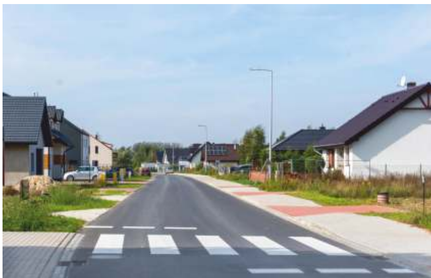
POBIEDZISKA UL. RZECZNA