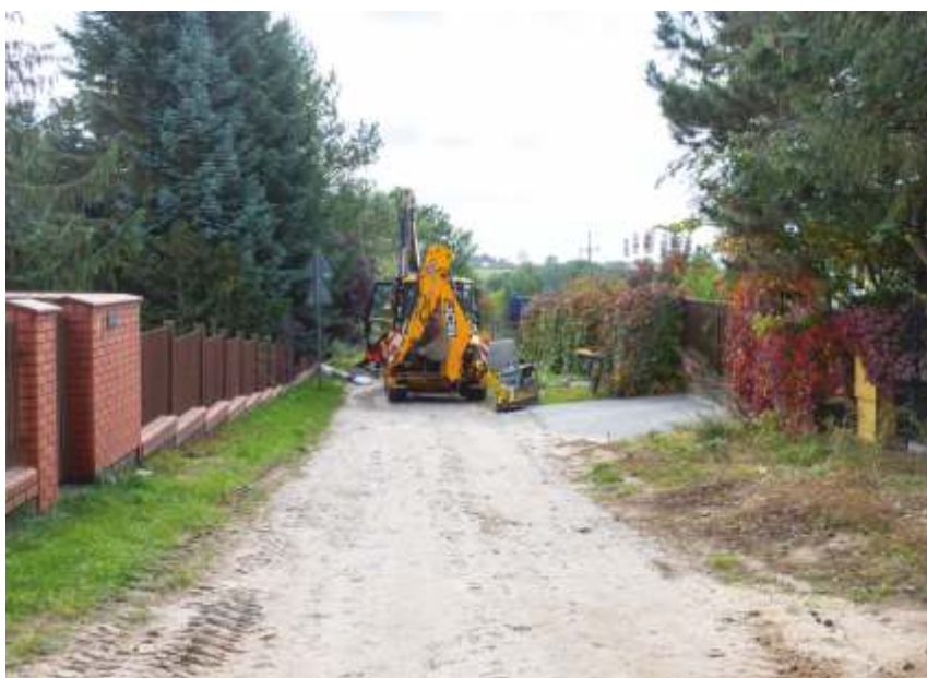
BISKUPICE UL. KRÓTKA

Wykonawca otrzymał ze Starostwa Powiatowego wezwanie do uzupełnienia braków formalno - prawnych, wśród nich konieczność wydania decyzji środowiskowej dla obu zadań. Realizacja zadania wydłuży się o kilka miesięcy.