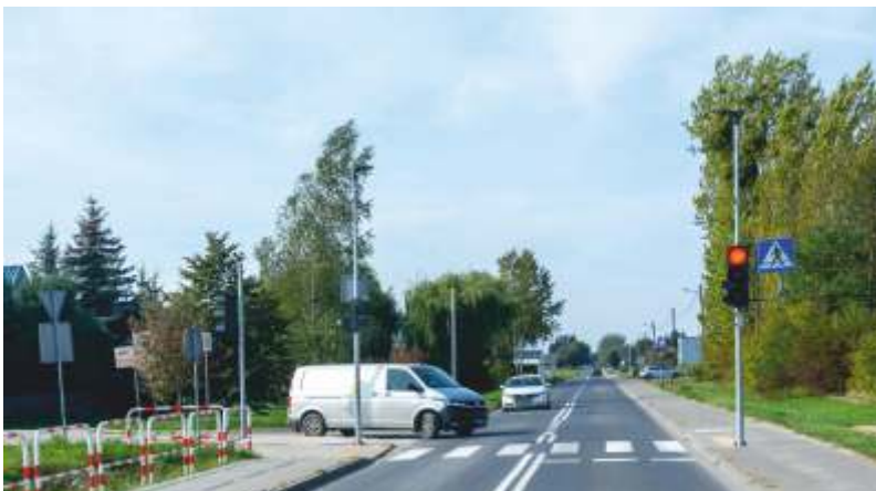
POBIEDZISKA UL. POZNAŃSKA/MALWOWA

Zakończono prace przy przejściu dla pieszych wraz z sygnalizacją świetlną i rampą umożliwiającą dojazd oraz dojdzie z ul. Kostrzyńskiej do Centrum Handlowego zlokalizowanego w południowej części miasta, przy drodze wyjazdowej w kierunku Poznania i Kostrzyna.