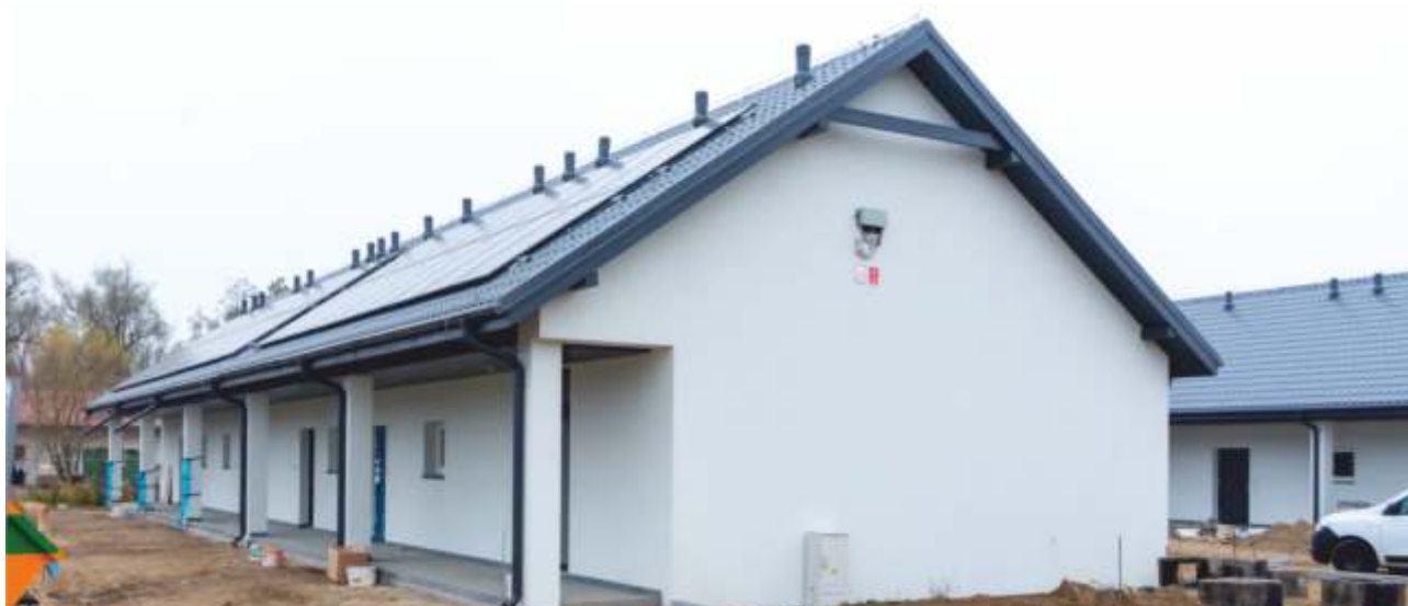
BUDYNKI MIESZKALNE - BORÓWKO

Zakończono modernizację oświetlenia kortów tenisowych w Pobiedziskach na kwotę 46 530,90 zł. Rozpoczęto prace przy modernizacji boiska wielofunkcyjnego w Biskupicach. Wartość zadania: 538 808,29 zł.