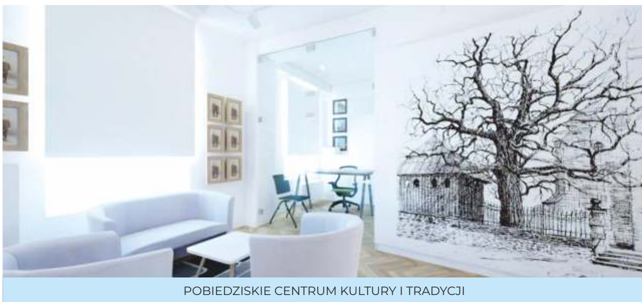
POBIEDZISKIE CENTRUM KULTURY I TRADYCJI