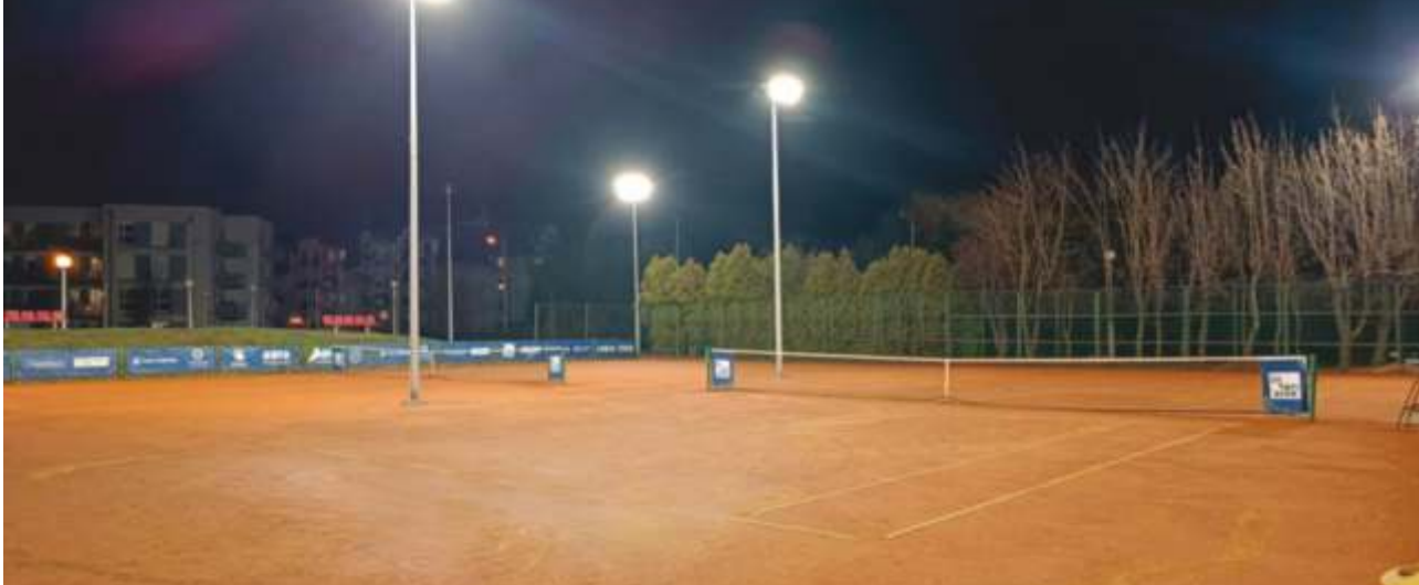
KORTY TENISOWE - POBIEDZISKA