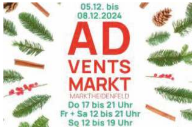
Logo jarmarku adwentowego w Markttheidenfeld

Od 30 listopada do 20 grudnia można dać się ponieść ciepłej i świątecznej atmosferze, która zapanowała w całym mieście. Wesołe miasteczko, lalkarze opowiadający poruszające i pobudzające wyobraźnię historie, pokazy filmu LÉO czy spacer śladami Świętego Mikołaja to tylko wybrane atrakcje dla mieszkańców Montfort su Meu i turystów. Wszystkim życzymy Radosnych Świąt! Joyeux Noël!