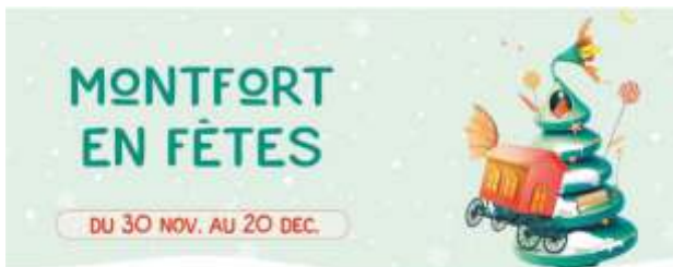
Logo imprez adwentowych w Montfort sur Meu

W wesoły, adwentowy nastrój wprowadza mieszkańców Montfort cykl imprez przygotowanych pod wspólnym tytułem "Montfort en fetes".