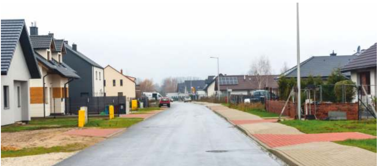
POBIEDZISKA UL. RZECZNA