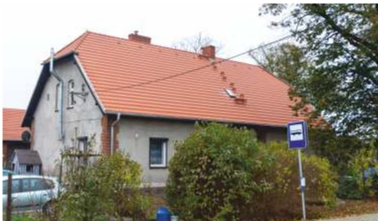
BUDYNEK KOMUNALNY - LATALICE

Zbliżają się do końca prace budowlane przy "Budowie dwóch budynków mieszkalnych wielorodzinnych, socjalnych oraz czterech budynków gospodarczych wraz z infrastrukturą techniczną w miejscowości Borówko - obręb Zbierkowo, gmina Pobiedziska". Dofinansowanie z Funduszu Dopłat w ramach realizacji przez Bank Gospodarstwa Krajowego Rządowego Programu Budownictwa Komunalnego w kwocie: 2 773 340,25 zł. Wartość inwestycji: 2 828 637, 25 zł.