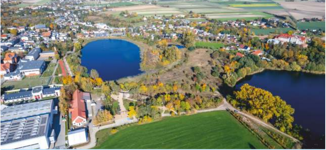
PROJEKT ZIELONO-NIEBIESKIE POBIEDZISKA