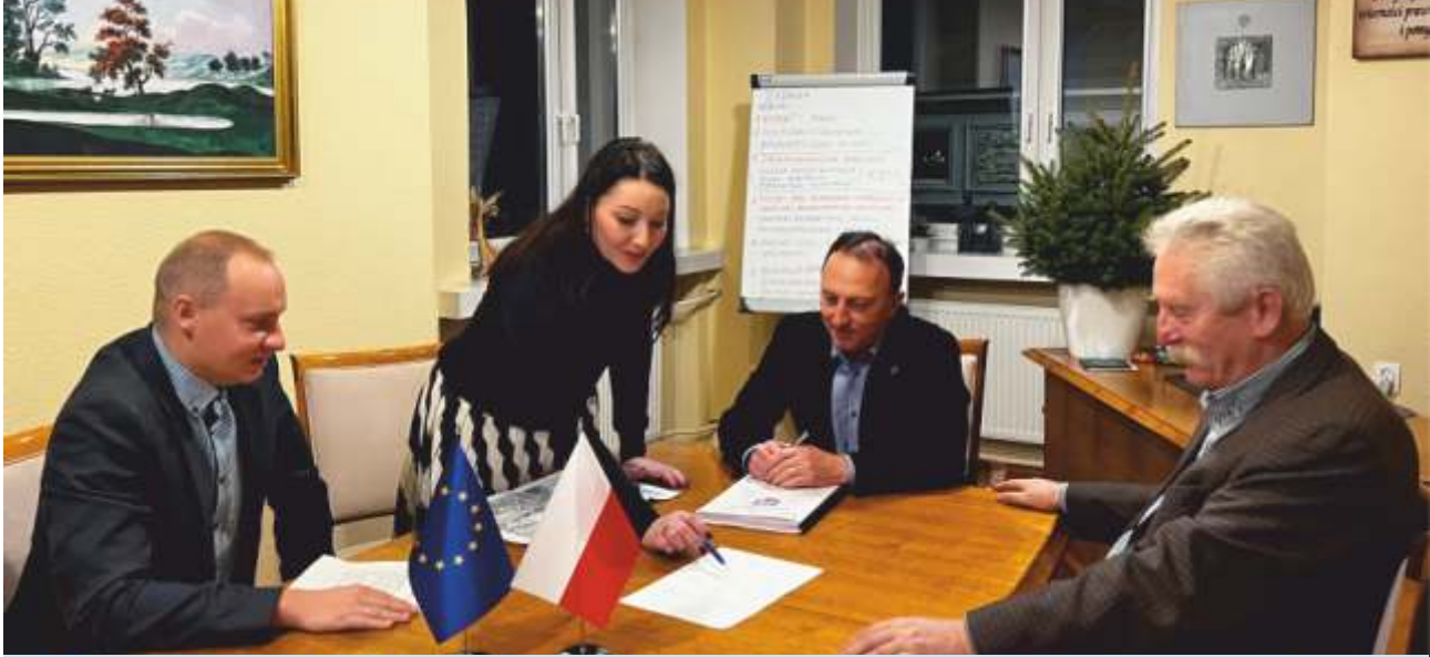
BEZPIECZEŃSTWO WE WRONCZYNIE I TUCZNIE